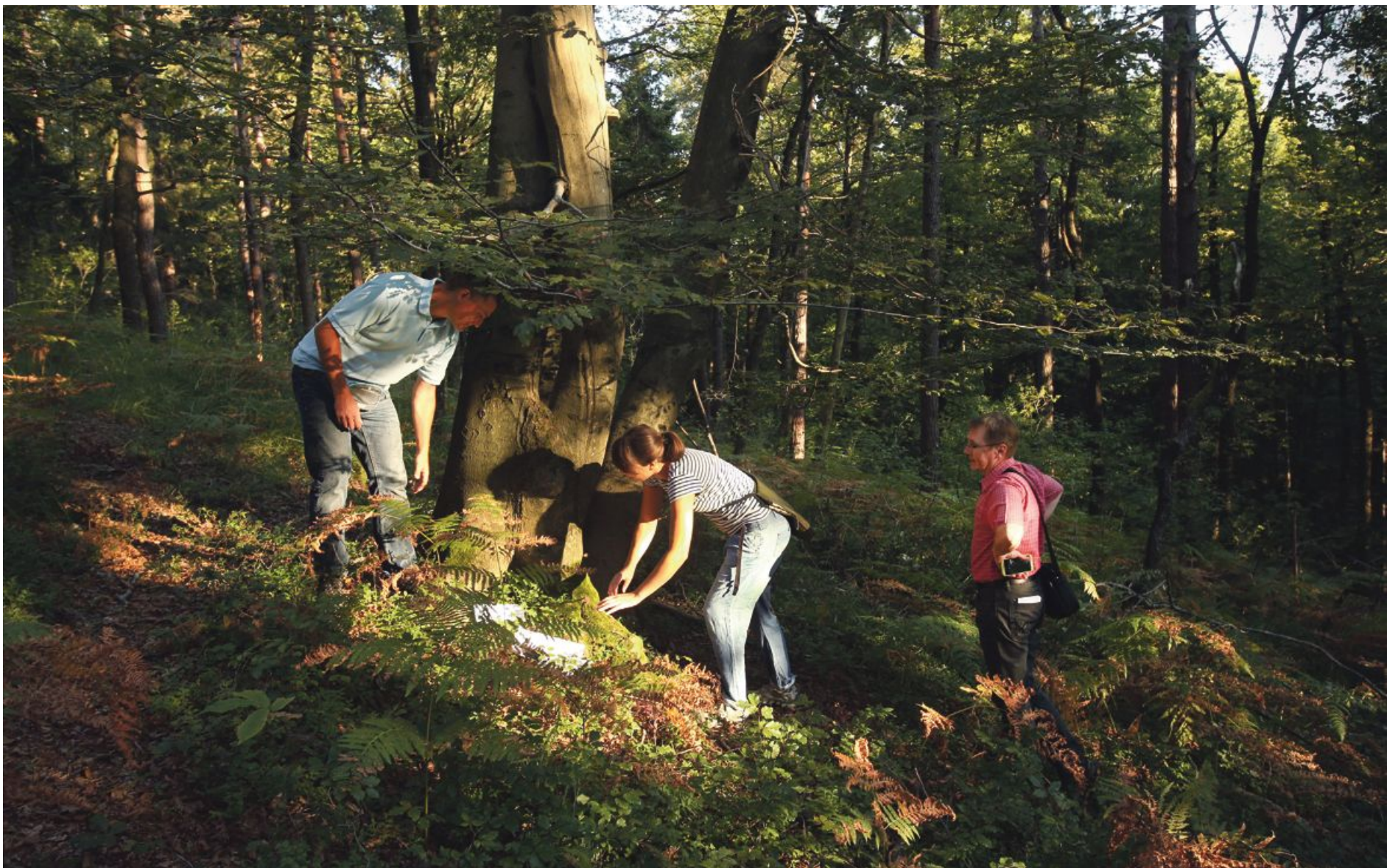
Za prvo vajo smo se zaklad odpravili iskat kar na bližnji Rožnik.